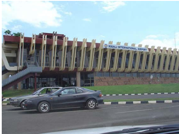
Figure 3. Uwanja wa ndege wa kimataifa wa Kigali

Mji wa Kigali una uwanja wa ndege wa kimataifa ambao ni mahali watu wanaweza kuenda ili wachukue ndege kusafiri kwenda Nairobi, Addis Ababa, Brussels, Bujumbura na Johannesburg. Pia kuna njia ya ndege ya taifa kutoka Kigali ya kwenda Cyangugu katika kusini-magharibi ya Rwanda.