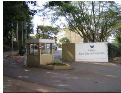
Figure 4. Hoteli itwayo ‘Mille Collines’

Hoteli nyingine iko katika mtaa wa Kacyiru na lilikuwa linaitwa ‘Le Meridien Umumbano’ lakini baada ya mauaji, kampuni ya Novotel ililinunua kwa hivyo jina lake ni ‘The Novotel Umumbano’.